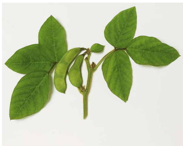
Soijan lehtiä ja palkoja.

tehty proteiineista, entsyymeistä, hormoneista ja vasta-aineista. Proteiinit koostuvat aminohappo- ketjuista. Proteiineissa esiintyy perusyksikkönä 20 erilaista aminohappoa, joista 10 on elimistölle välttämätöntä. Hevosen on saatava välttämättömät aminohapot rehuistaan, muut sen elimistö voi valmistaa. Lysiiniä lukuun ottamatta, yksittäisten aminohappojen tarvetta ei ole hevosille määritelty. Proteiinisynteesisä kaikkien välttämättömien aminohappojen on oltava saatavilla samanaikaisesti. Haasteena hevosten ruokinnassa on sisällyttää rehuihin riittävästi ja oikeanlaatuisia proteiineja, jotta sen elimistö pystyy syntetisoimaan kudoksia, entsyymejä ja hormoneja ja korjaamaan kudosvaurioita.