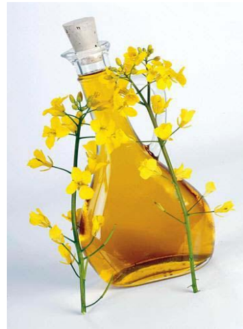
Rypsiöljy, Brassica rapa ssp oleifera

on ollut 76–94 % kun kokonaisrehuannoksessa on ollut 20 % rasvaa. Eläinperäiset rasvat sulavat huomommin kuin kasviperäiset. Eläinrasvat eivät myöskään ole niin puhtaita kuin kasvirasvat ja niiden maistuvuus on myös huonompi. Useissa tutkimuksissa maissi- ja soijaöljyt maistuivat parhaiten hevosille.