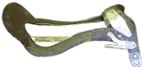
Moderni, metallivahvistettu puurunko.

Satulan rungon tehtävänä on jakaa ratsastajan paino tasaisesti hevosen koko satuloitalle alueelle sekä auttaa ratsastajaa istumaan mahdollisimman hyvin ja turvallisesti hevosen selässä.