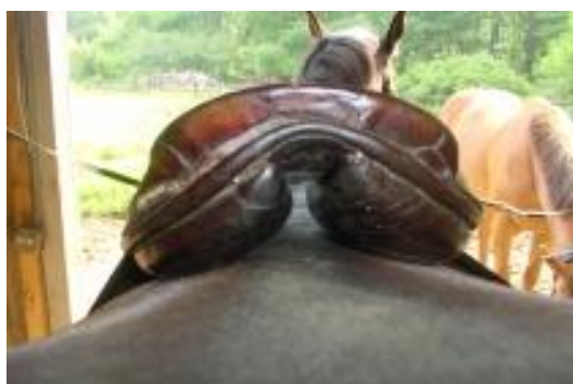
Liian kapea satulan kanava

Hevonen ei voi kipeytymättä kantaa painoa suoraan selkänikamillaan. Hyvä satula jättää myös rangan vapaaksi painosta. Joissakin vanhemmissa satuloissa tapaa vielä liian kapeita kanavia.