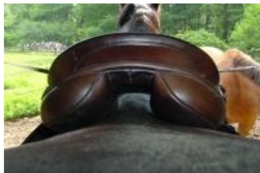
Riittävän leveä kanava, joka ei jaa painoa liian lähelle hevosen rankaa.

Rungottomat satulat eivät jaa ratsastajan painoa oikein vaikka ne saattavat jättää rangan vapaaksi painosta. Ratsastajan paino kohdistuu suoraan vain niille nikamille joiden päällä ratsastaja istuu. Hevonen ei voi kipeytymättä kantaa ratsastajan painoa vain muutamalla nikamalla.